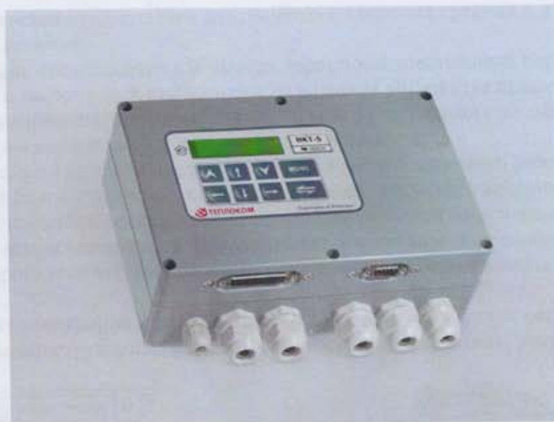
Рисунок 1 – Внешний вид вычислителя